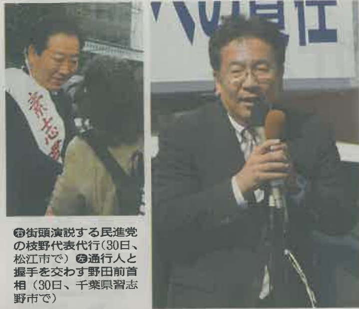
①街頭演説する民進党の枝野代表代行(30日、松江市で) ②通行人と握手を交わす野田前首相(30日、千葉県習志野市で)