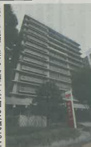
民営化から10年となる日本郵政グループ(東京・霞が関で)

は都内でPRイベントを開催、賛同の輪は靴職人や小売店にも広がってきた。捨てられていたからといって安売りするのは、縮小する皮革産業の復活と、農業被害に苦しむ地域の活性化につながる。「製品の質を高め、消費者にアピールしたい」と意気込む。「売れる物が良いとされる社会ではなく、良い物が売れる社会になってほしい」(科学部 蒔田一彦)